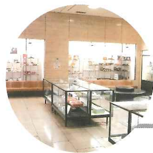
郷土物産コーナー